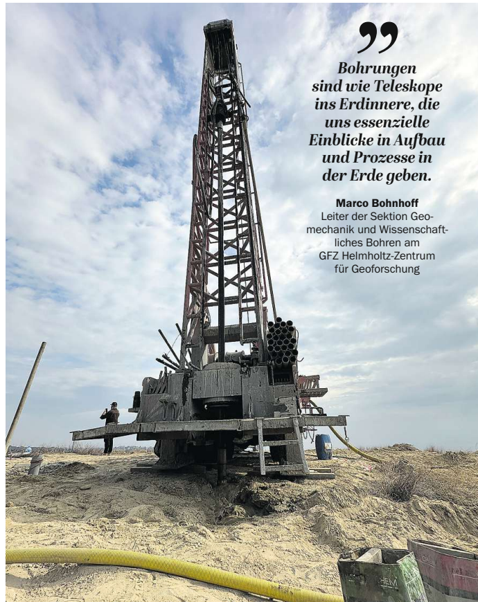
Erdbeben im Blick: Bohrung für eine von zehn Messstationen am Marmarameer nahe Istanbul

Das KTB erweiterte grundlegend unser Verständnis zur Zu-